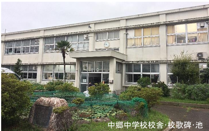
中郷中学校校舎・校歌碑・池