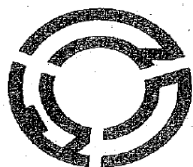
馬來田小学校校章