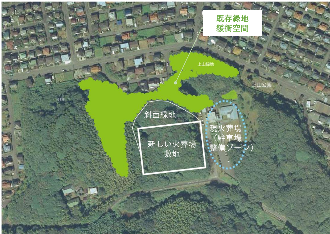
図 新しい火葬場敷地周辺の状況