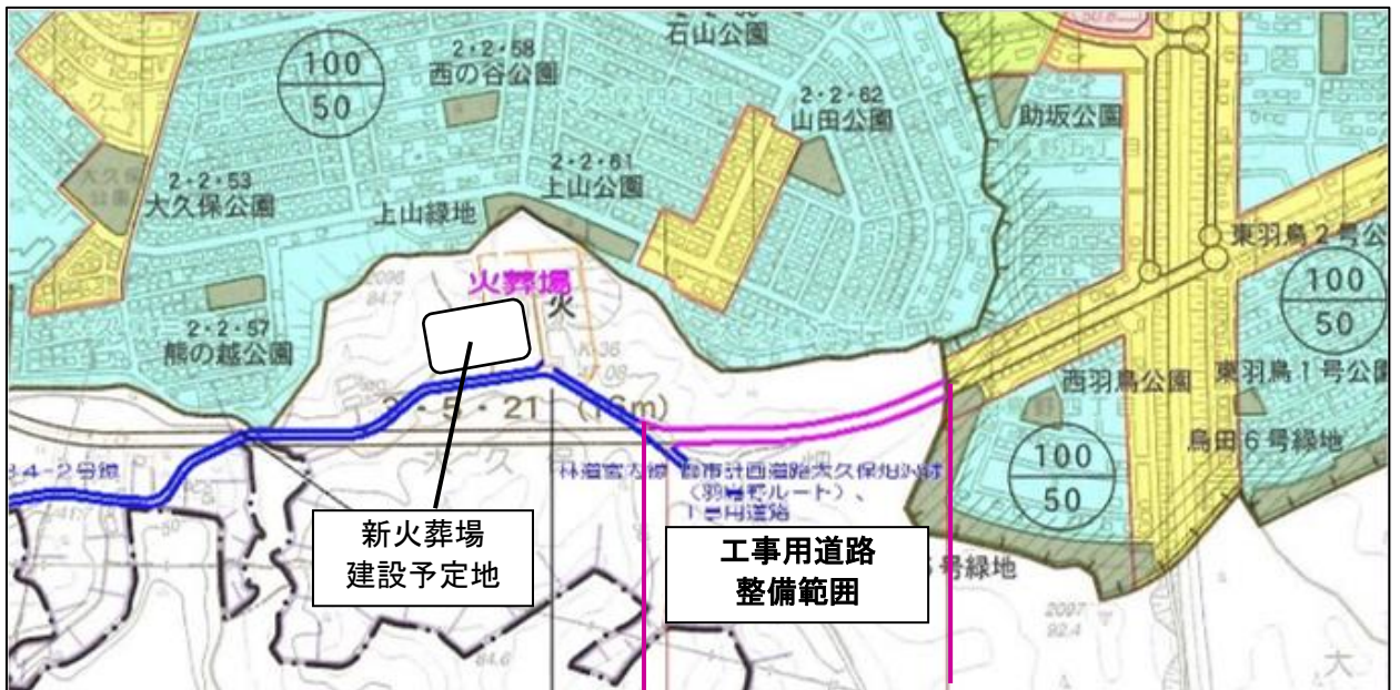
図 工事中道路整備範囲