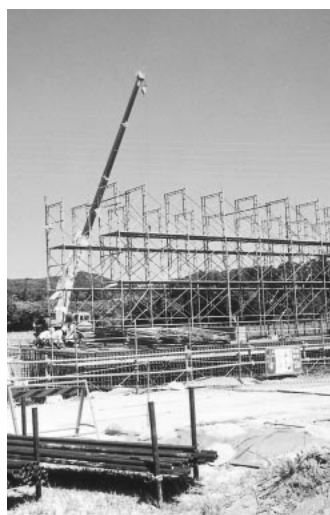
建設中の首都圏中央連絡自動車道の富岡地区