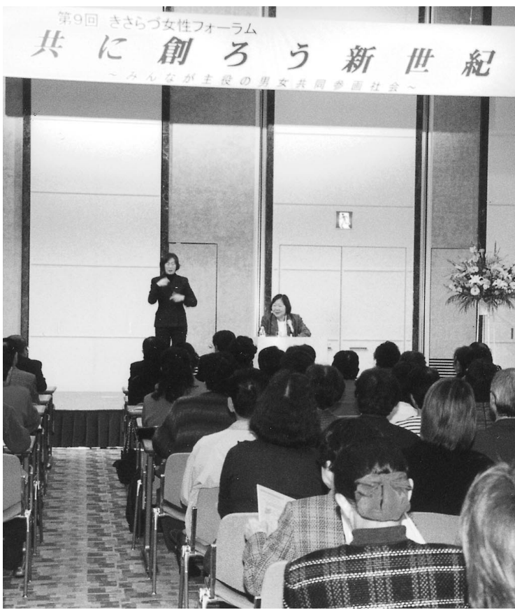
第9回 きさらづ女性フォーラム

また、計画づくりに際しては、幅広く意見を聞き、関係機関とも調整を図りながら、本市にふさわしい男女共同参画計画を策定したい。