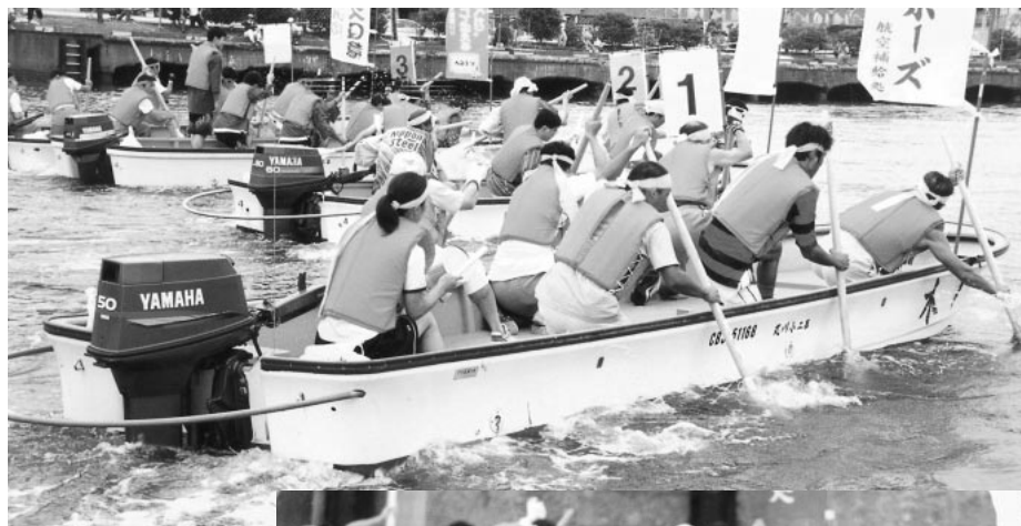
今年も開催される 木更津港まつり べか舟手こぎ競漕

http://www.city.kisarazu.chiba.jp/gikai/