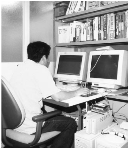
アインビル8階 テレワークセンター

答 今年六月に組合の役員改選が行われるとのことで、その新体制のもとでこれについて再検討をしていくと聞いている。 従って、現在、組合の動きは何もないものと認識しているところである。