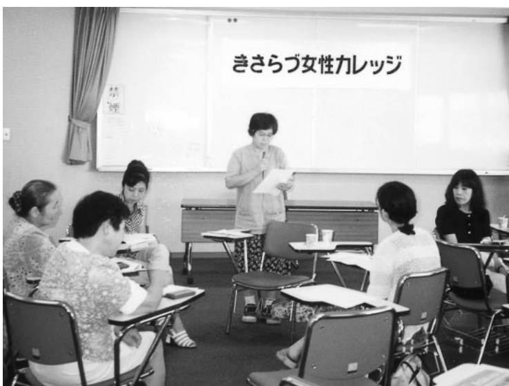
木更津女性カレッジ

計画に定めた目標値三十%以上には及ばないが、毎年向上している。本年四月一日現在の女性管理職は昨年より九人増の十二人を登用している。 労働行政については、制度的に国の対応が基本であり、現状における市の業務は就業相談等が主なので、市として女性就労者の健康管理や母性保護等に関する調査等は行ったことはない。 環境浄化活動の一環として、青少年指導員の方々が、通称ピンクピラ等の撤去活動を行っている。