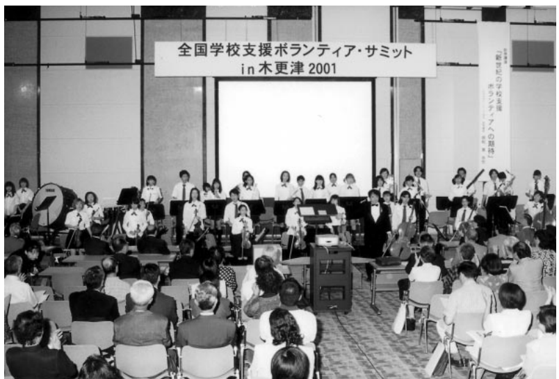
全国学校支援ボランティア・サミット

り、今後とも、学校支援ボランティア活動の一層の充実・発展のために努力してまいります。