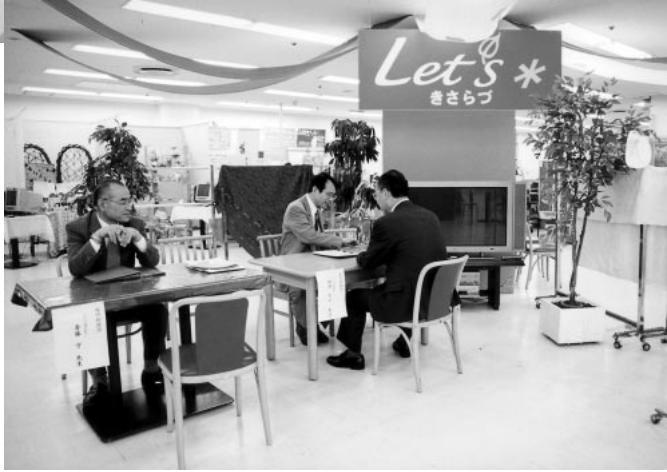
アインビル8階のチャレンジセンターLet's木更津