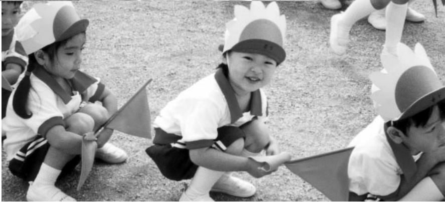
はじめての 楽しい運動会