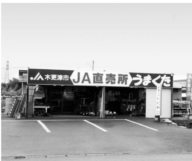
馬來田駅前の直売所(うまくた)

に約二千平方メートルの用地を確保し、道路付帯施設としてパーキングとトイレを整備するとの内容である。市としては、これらの用地を含め、拠点整備地域に農産物直売所を併設することを念頭に、今後、庁内調整や地元協議を進め、実現化できるよう努力するものである。この進め方については、市の財政状況、また、県あるいは地元の意向等を十分考慮しながら、関係者が一体となり推進を図りたいと考えているところである。