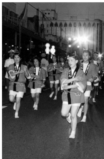
やっさいもっさい踊り

答 市民の多くの方に参加していただき、市民が一体となり、まちの活性化に役立つことができればと思う。今後も市民のふれあいはじめ、市民の憩いと安らぎの場としての踊りとなるよう努力していきたい。