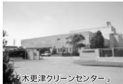
『木更津クリーンセンター』

ところである。 問 今後の業務委託について、指名競争入札に決すのか 答 契約三年目という観点から、平成十五年度においては指名競争入札とした