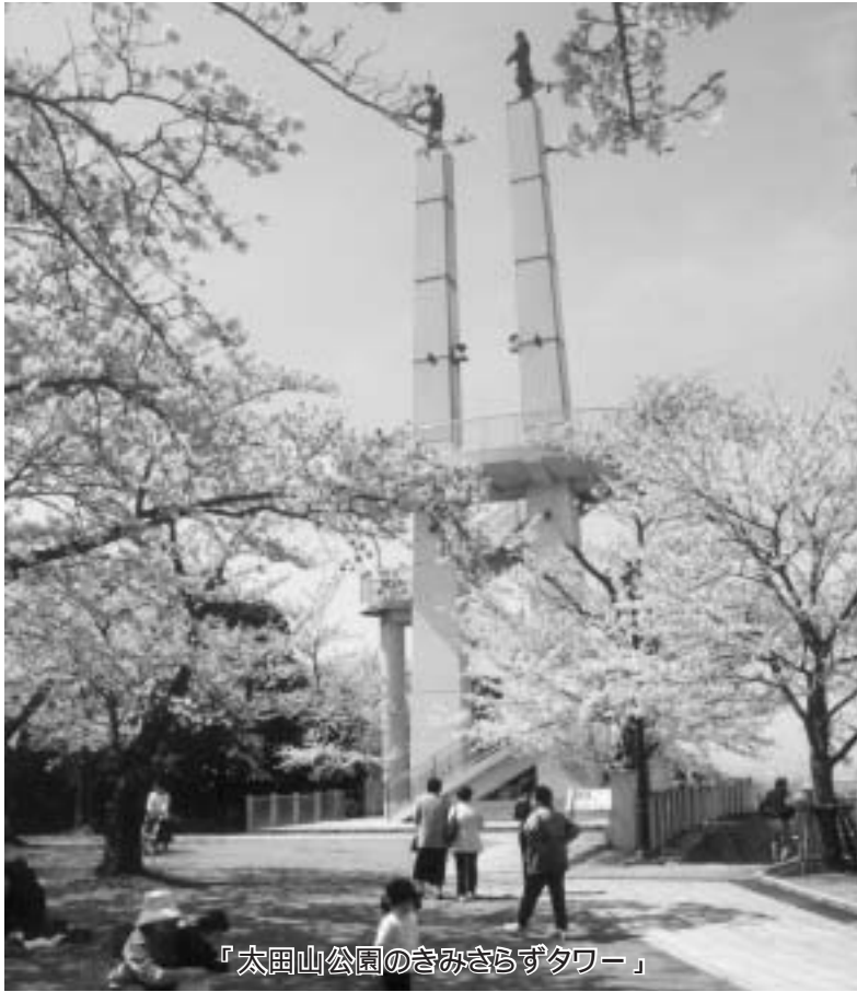
『太田山公園のきみさらづタワー』

http://www.city.kisarazu.chiba.jp/gikai/