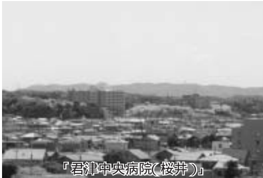
『君津中央病院(桜井)』

院組合側に対し、財政収支計画のさらなる検討、二十一億三千万円とされる負担金の見直し及び今後見込まれる累積赤字に対する負担はできないことを申し入れしてある。