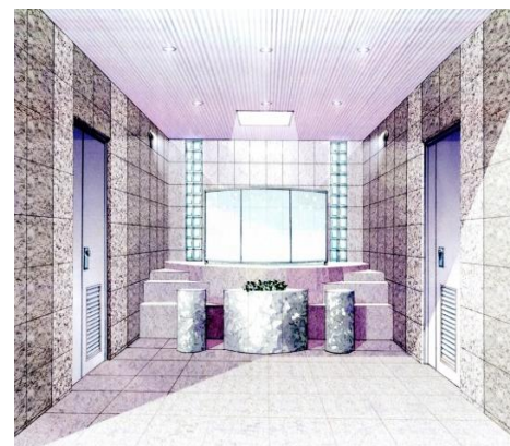
合葬式墓地礼拝所