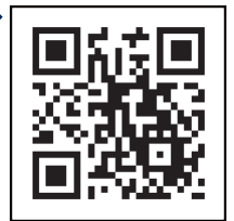
「コロナワクチンナビ」 二次元コード