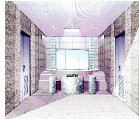
合葬式墓地礼拝所